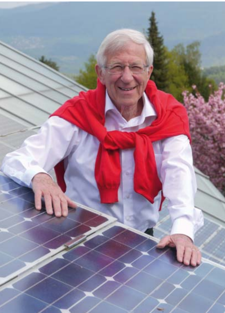
Dr. Franz Alt

Mit seinen „Report“-Sendungen aus Baden-Baden erreichte er ein Millionenpublikum. Und auch nach zehn Jahren im Fernseh-Ruhestand ist er medial immer noch äußerst präsent. Ob Vier-Augen-Gespräch mit der Bundeskanzlerin oder Diskussionsrunde mit Lesern einer Lokalzeitung – Dr. Franz Alt ist auch mit 75 Jahren kein bisschen leise.